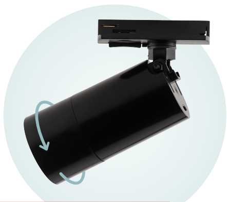
Фиксация лампы без стопорного кольца

Лампа в светильнике фиксируется декоративной рамкой, повторяющей форму корпуса и соединяющейся с ней при помощи резьбового соединения. Стопорное кольцо для удержания лампы не применяется, что повышает эстетику.