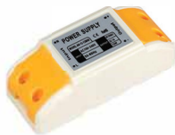
ARV-AL12012M ARV-AL12024 ARV-AL12036 ARV-AL24012M ARV-AL24024 ARV-AL24036