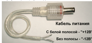
Рис.4. Кабели питания и управления влагозащищенной ленты с индексом «Р»