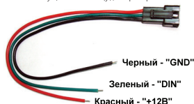
Рис.3. Кабель для подключения открытой ленты и ленты с индексом «SE»