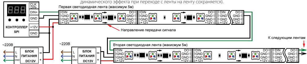
Рис.2. Схема подключения ленты при управлении от внешнего контроллера.