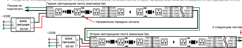
Рис.1. Схема подключения ленты без использования внешнего контроллера (максимум 1024 пикселя, общий рисунок динамического эффекта при переходе с ленты на ленту сохранится).