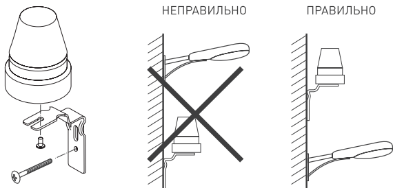
Рис. 1. Монтаж и размещение фотореле

⚠ ВНИМАНИЕ! Располагайте фотореле таким образом, чтобы свет от включаемого светильника не попадал на датчик. Перед фотореле не должно быть препятствий, мешающих прохождению естественного света к датчику. Перед фотореле не должны располагаться движущиеся или качающиеся объекты.