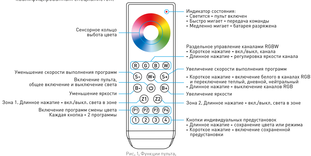
Рис. 1. Функции пульта.

При монтаже оборудования, используемого совместно с пультом, во избежание поражения электрическим током, перед началом работ отключите электропитание. Все работы должны проводиться только квалифицированным специалистом.